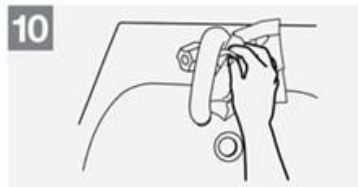
10 Chiudere il rubinetto con l'asciugamano