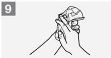
9 Asciugare interamente con asciugamano monouso