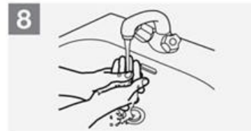
8 Sciacquare le mani con acqua