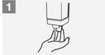
1 Applicare abbastanza sapone da coprire le superfici delle mani