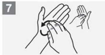
7 Dita della mano sinistra nel palmo destro e viceversa