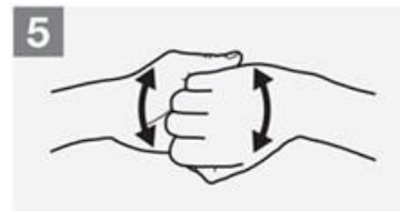
5 Dorso delle dita ai palmi opposti con dita reciprocamente bloccate