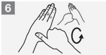
6 Pollice sinistro nel palmo della mano destra e viceversa