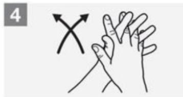
4 Palmo a palmo con dita intrecciate