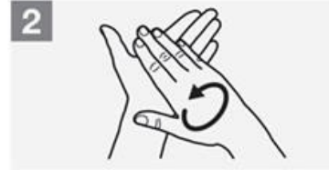
2 Strofinare le mani palmo a palmo