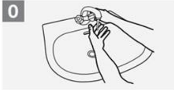
0 Bagnare le mani con acqua